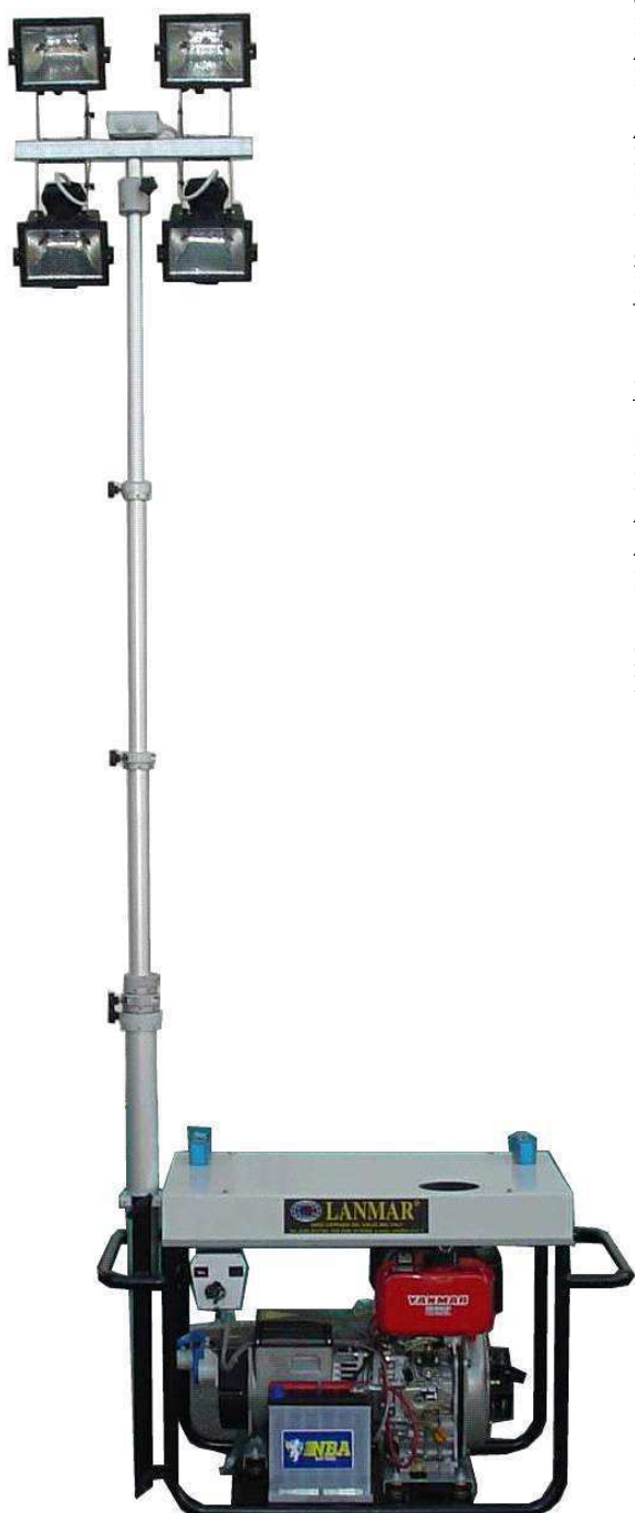
MOBILUX 1 ANTENNA SFILATA

IL MOBILUX 1 È DISPONIBILE ANCHE IN VERSIONE CON MOTORE DIESEL DI POTENZA CONTINUA 6,5 KVA = 5,2 KW.