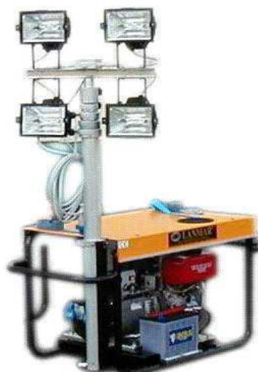
MOBILUX 1 ANTENNA CHIUSA